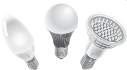
LAMPES À LED